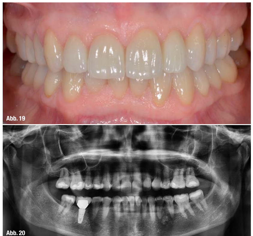
Abb. 19 und 20_ Endergebnis nach 1,5 Jahren.

Abb. 18_ Vor Eingliederung der Zähne 45–47; 46 Hybridabutment.