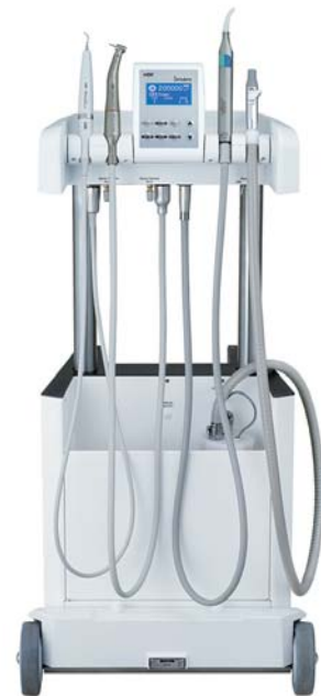
▲ Abb. 3: Mobile Behandlungseinheit (Abdruck mit freundlicher Genehmigung der Firma NSK Europe, Eschborn).

dürftige verabschiedeten Abrechnungsziffern sowie die Entwicklung des Kooperationsvertrages geben die Möglichkeit und spannen den Rahmen für die mobile Zahnheilkunde, dennoch wurde seitens der Kassenzahnärztlichen Bundesvereinigung sowie der Bundeszahnärztekammer Kritik laut, dass zum einen Pflegebedürftige außerhalb stationärer Einrichtungen von diesem Gesetz ausgeschlossen sind und zum anderen der Versorgungsanspruch auf den gesetzlichen Leistungskatalog (BEMA) beschränkt bleibt.