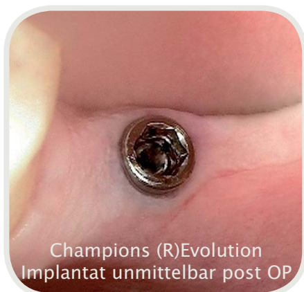
Champions (R)Evolution Implantat unmittelbar post OP

Die sanfte & sichere Implantations-Methodik