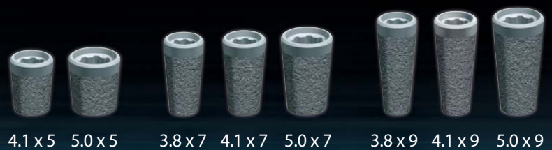
4.1 x 5 5.0 x 5 3.8 x 7 4.1 x 7 5.0 x 7 3.8 x 9 4.1 x 9 5.0 x 9