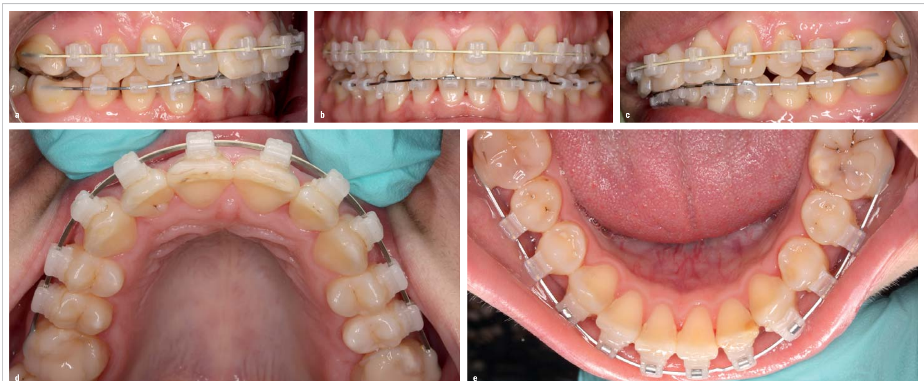
Abb. 5a-e: Zustand nach zwölfmonatiger Behandlung. Die Zahnbögen sind soweit ausgeformt, wobei die Bisshhebung mittels frontaler Aufbisse erfolgte. Mithilfe von Klasse II-Gummizügen wird noch die Distalokklusion zu korrigieren sein.

Das splitterfreie Ablösen des TruKlear® Brackets kann auf zweierlei Art und Weise realisiert werden – zum einen mithilfe des Pauls-Tools, einem speziellen Instrument zur fragmentfreien Bracketentfernung, zum anderen mittels Debondingzange, welche an den speziellen, mesial wie distal befindlichen Debondingschrägen des Brackets angesetzt wird.