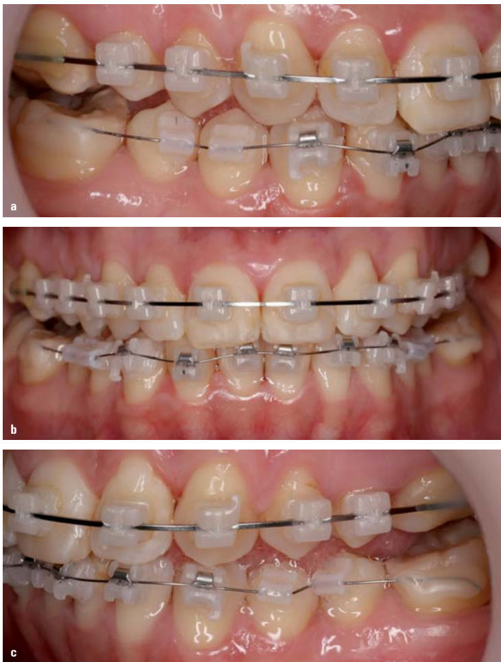
Abb. 3a-c: Intraorale Aufnahmen nach achtmonatiger Behandlung. Es wurden von 3-3 im Unterkiefer aktive QuicKlear® Brackets geklebt.