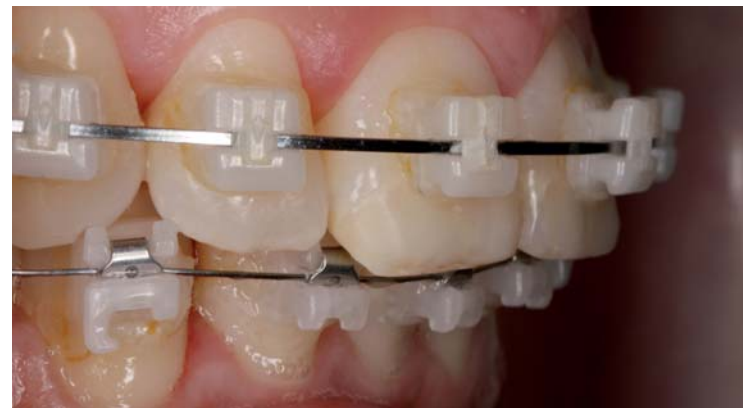
Abb. 4: Detailaufnahme zehn Monate nach Behandlungsbeginn.

Auch wenn Patienten mit dem Einsatz moderner selbstligierender Keramikbrackets verschiedener Hersteller eine ästhetisch ansprechende kieferorthopädische Behandlung bei hohem Tragekomfort ermöglicht werden kann, trübte bislang stets ein kleines Detail deren optische Perfektion – der Clip. So weisen viele am Markt befindliche Keramikbrackets beispielsweise einen gänzlich aus Metall gefertigten Clip auf. Andere haben einen in den keramischen Bracketkörper integrierten metallenen Haltemechanismus für den Clip bzw. Schieber, der optisch durchschimmernd den ästhetisch hohen Eindruck des Keramikmaterials mindert. Oder wiederum andere Keramikbrackets verfügen über einen aus Kunststoff gefertigten Clip, der aufgrund von Verfärbung im Laufe der Behandlung die ästhetische Wahrnehmung beeinträchtigt.