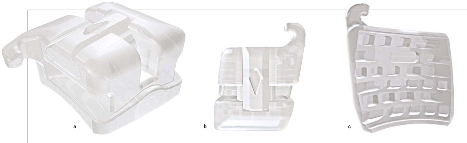
Abb. 1a-c: TruKlear® Bracket.