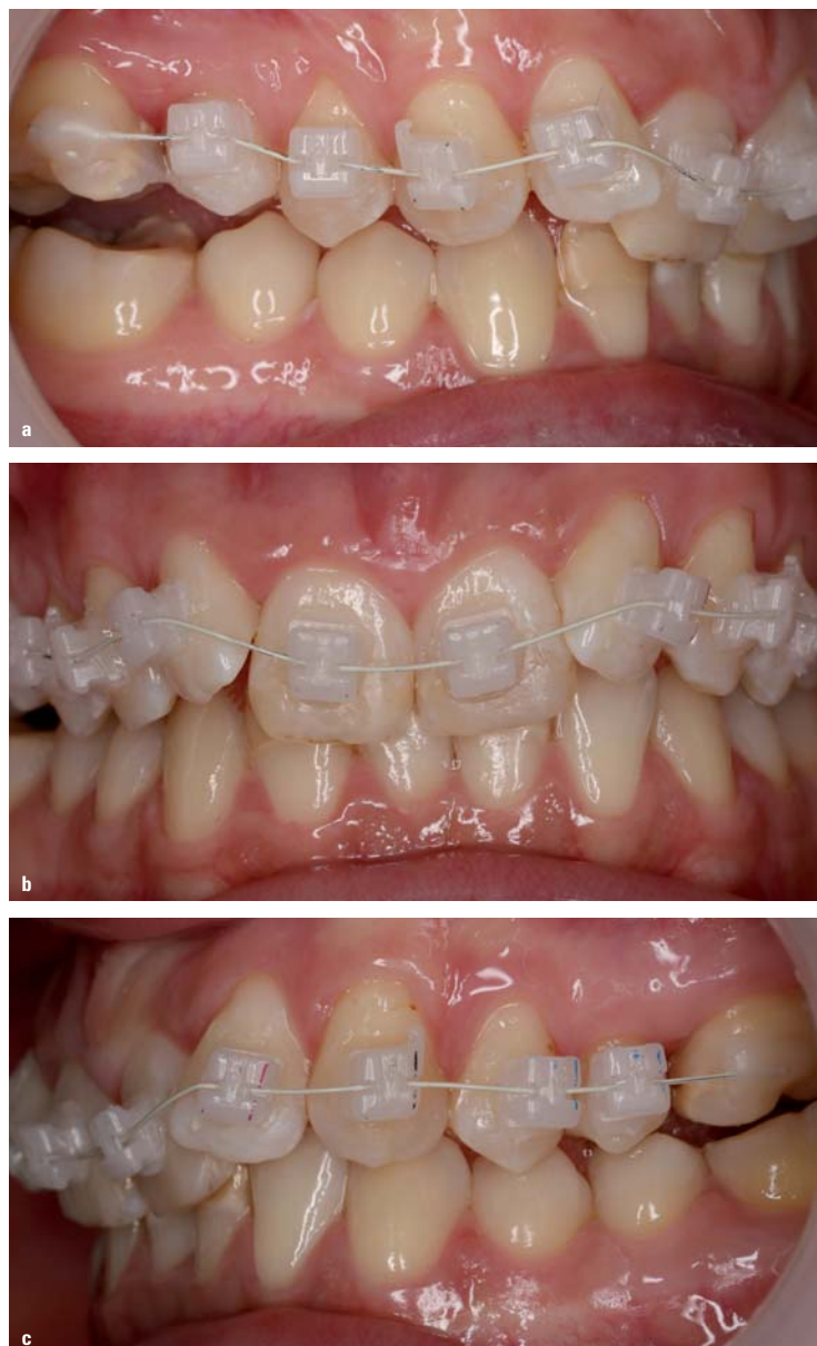
Abb. 2a-c: Intraorale Aufnahmen des Behandlungsbeginns mit passiven TruKlear® Brackets im OK.