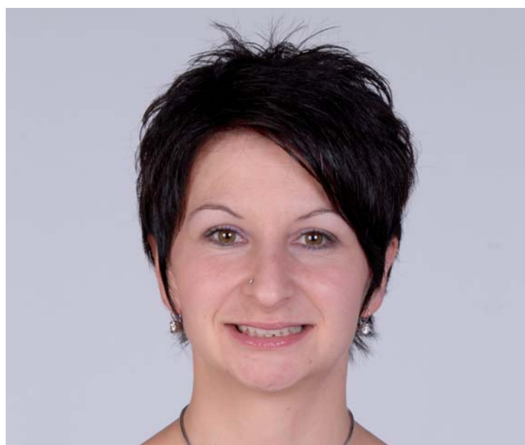
Abb. 6 und 7: Situation nach komplett abgeschlossener Behandlung.