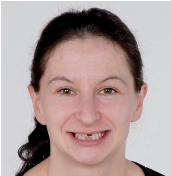
Abb. 1: Ästhetische und funktionelle Einschränkungen durch multiple Aplasie.

Optimale Kommunikation im Behandler Netzwerk – eine Falldarstellung von Dr. Michael Visse und ZA Claus Theising.