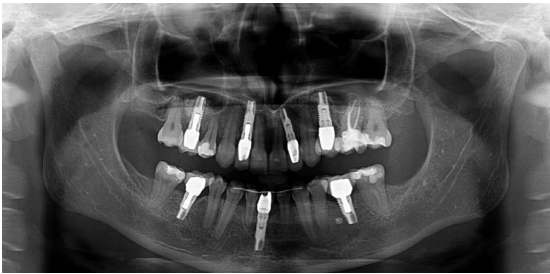
Abb. 5: Insetierte Implantate im Ober- und Unterkiefer.