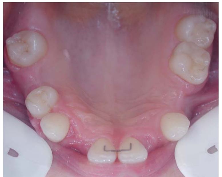
Abb. 4: Situation nach abgeschlossener KFO.

Auf Grundlage einer dreidimensionalen Diagnostik und Planung wurden nach Entfernung der Multibandapparatur von einem Mund-, Kiefer- und Gesichtschirurgen mittels Bohrschablone in die Lücken vier Implantate im Ober- und drei im Unterkiefer gesetzt. Nach der Einheilphase erfolgte die prothetische Versorgung mit vollkeramischen Kronen in der Zahnarztpraxis.