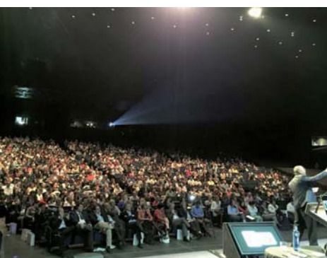
Rund 800 Ärzte aus 47 Ländern waren zum diesjährigen Damon-Forum nach Barcelona gereist.

In Barcelona fand das internationale Damon-Forum 2015 statt.