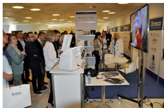
Links: Präsentation digitaler Produktlösungen in den Pausen. – Rechts: Köstlichkeiten bei beeindruckendem Ambiente – das Galadiner im Museu Nacional d'Art de Catalunya.