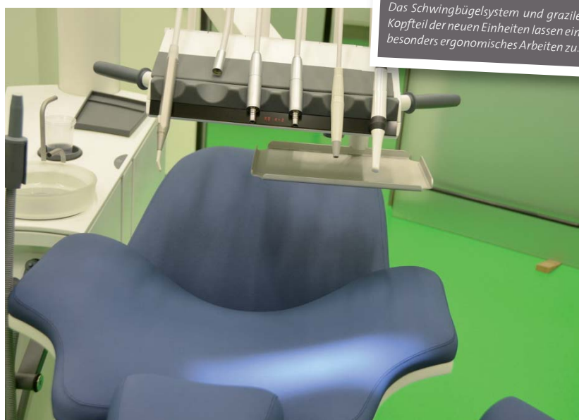
Das Schwingbügelsystem und grazile Kopfteil der neuen Einheiten lassen ein besonders ergonomisches Arbeiten zu.