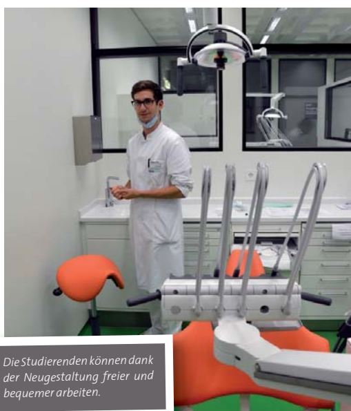
Die Studierenden können dank der Neugestaltung freier und bequemer arbeiten.

Durch die neuen Einheiten haben wir vor allem mehr Behandlungsplatz gewonnen. Der Bereich um die Einheit ist größer geworden, weil die Einheit kleiner ist. Dadurch hat man mehr Bewegungsfreiheit und kann in mehreren Positionen um den Stuhl herum sitzen. Wir haben gleichzeitig die Wände um die Den-