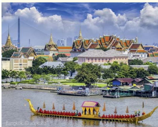
Bangkok: © anpkoho