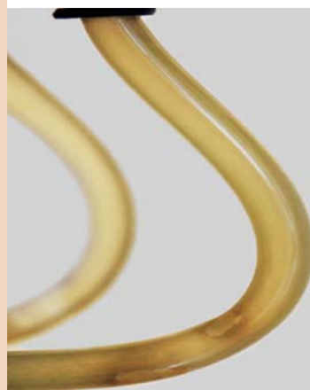
Wegen H 2 O 2 : Biofilmbildung

Klingt stichhaltig? Ist es auch. Und Sie können das auch.