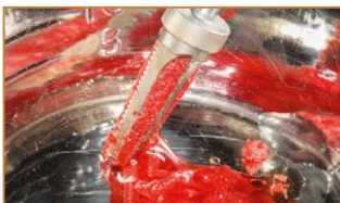
Mehrfachbohrer mit Sammelkammer für autologes Knochenmaterial