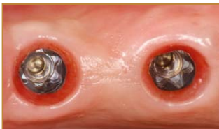
Konische Innensechskantverbindung mit einer basalen parallelwandigen Torxverbindung