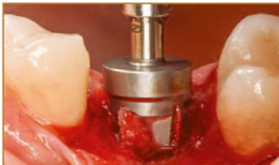
Tiefen- / Anschlagstop