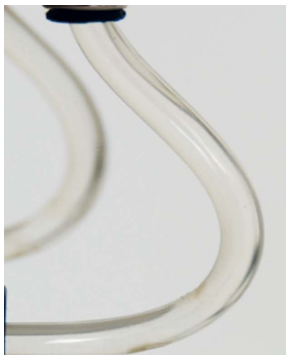
Mit SAFEWATER von BLUE SAFETY