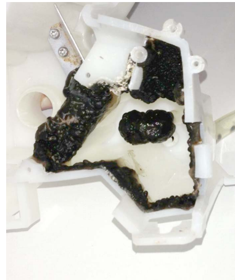
Biofilme in dentalen Behandlungseinheiten