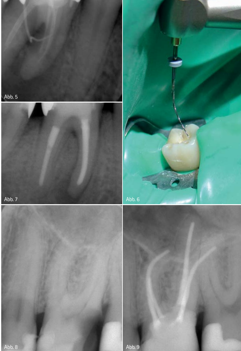
Fall 2 – Abb. 5: Ausgangssituation mit Guttapercha im Fistelgang. – Abb. 6: Pulpaeröffnung mit vorgebogenem Instrument. – Abb. 7: Situation nach sechs Monaten. Fall 3 – Abb. 8: Ausgangsbefund. – Abb. 9: Situation nach WF.

Kanal zu reinigen. Der mit Guttapercha und GuttaFlow 2 gefüllte Kanal war auf dem Röntgenbild deutlich sichtbar. Obwohl solche extrem gekrümmten Wurzelkanäle eher die Ausnahme bilden, ist es doch beruhigend zu wissen, dass selbst in diesen Fällen keine zusätzliche Ausrüstung notwendig ist und mit den Standardinstrumenten mühelos und ohne größeres Risiko aufbereitet werden kann.