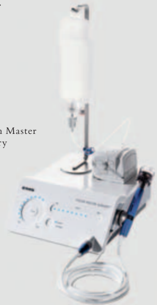
Piezon Master Surgery

EINZIGARTIG in der Welt der Chirurgie – das 3-Touch-Panel zur intuitiven Bedienung.