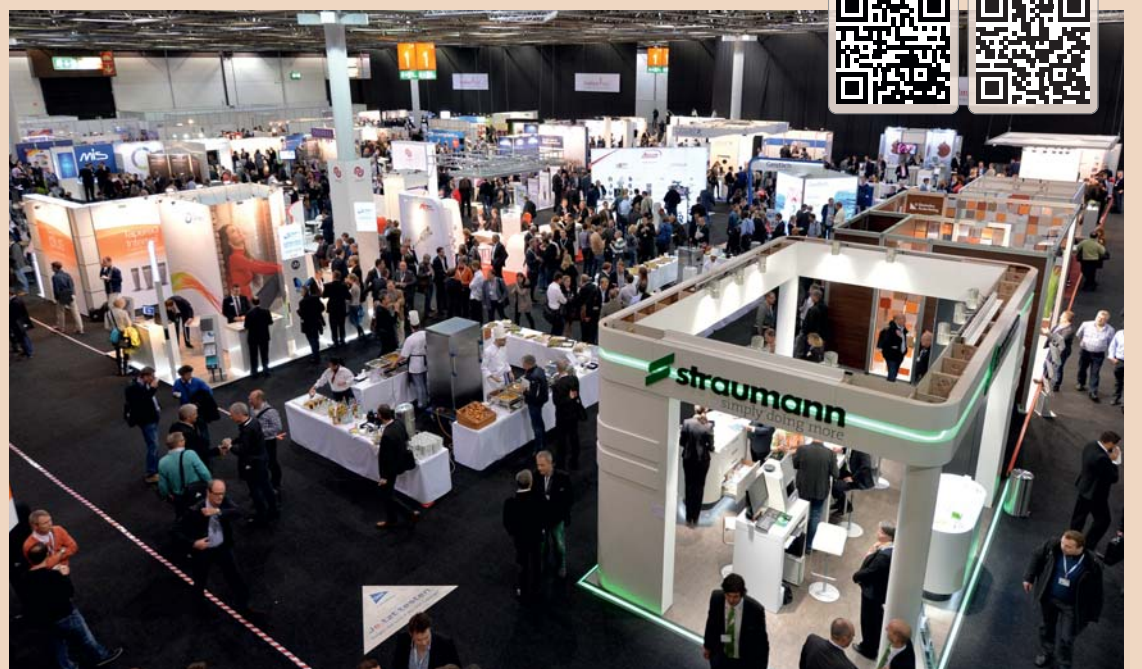
Impressionen aus Düsseldorf von der 5. Implant expo® im vergangenen Jahr.