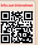
Infos zum Unternehmen

Straumann GmbH Tel.: +49 761 4501-336 www.straumann.de