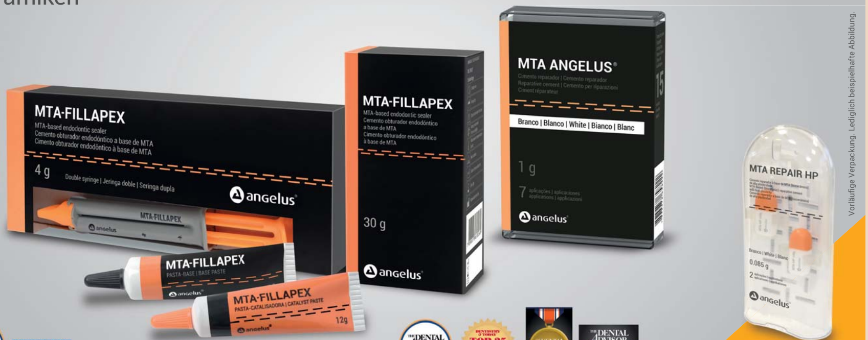
Vorläufige Verpackung. Lediglich beispielhafte Abbildung.