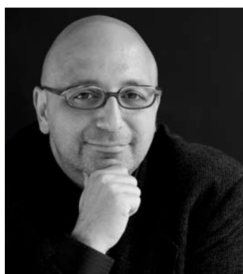
Festredner Prof. Dr. Armin Nassehi

zum Beispiel über die Einsätze bayerischer Zahnärzte in Nepal und Äthiopien. <<