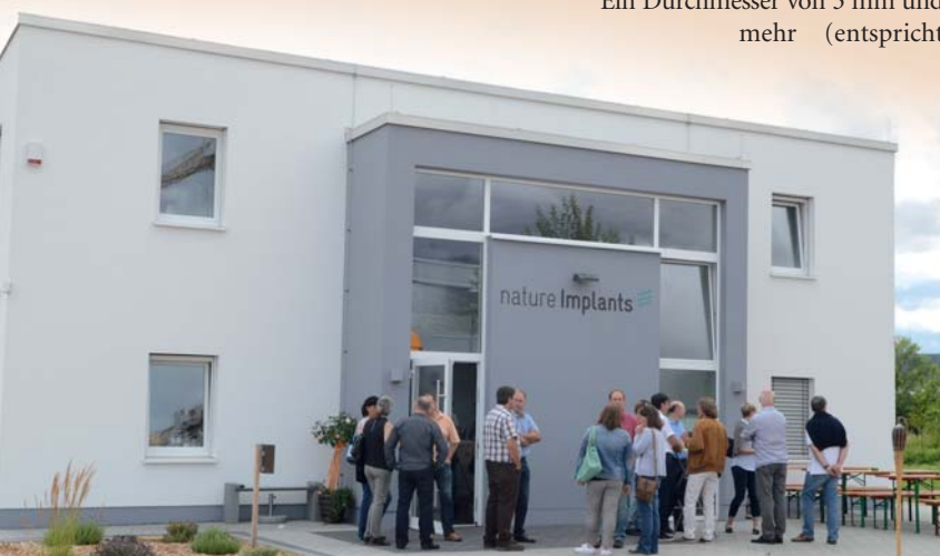
Am 25. Juli 2015 wurde der neue Firmensitz von nature Implants in Bad Nauheim eingeweiht.