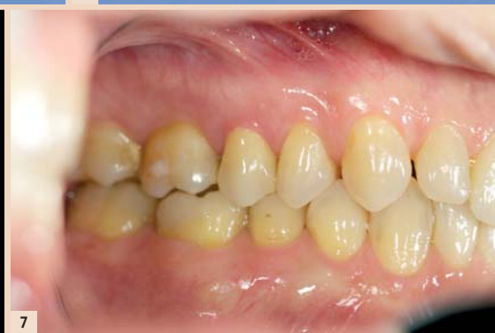
Abb. 1: Substanzschonend wurde die insuffiziente Metallkeramikkrone entfernt ... – Abb. 2: ... und eine keramikgerechte Stufenpräparation mit abgerundetem Innenwinkel angelegt. – Abb. 3: Virtuelle Konstruktion nach digitaler Abdrucknahme. – Abb. 4: Die Krone kann in allen drei Dimensionen verschoben werden. ... – Abb. 5: ... um eine optimale Farbwirkung als Resultat des richtigen Verhältnisses von Dentin- und Schmelzanteil zu erzielen. – Abb. 6: Aus VITABLOCS RealLife geschliffene Krone. – Abb. 7: Endergebnis.

Bei der Entwicklung von VITABLOCS RealLife wurde auf die klinisch bewährte VITABLOCS Mark II-Keramik zurückgegriffen, aus der seit 1990 über 20 Millionen Restaurationen mit klinischen Erfolgsraten von über 90 Prozent bei Inlays, Onlays und Kronen gefertigt wurden. Kombiniert wurde dies mit einem neuartigen geometrischen Aufbau, der in seiner Schichtstruktur den natürlichen Zahnaufbau nachbildet. Entwickelt wurde das innovative Blockkonzept speziell für hochästhetische Frontzahnrestaurationen in Form