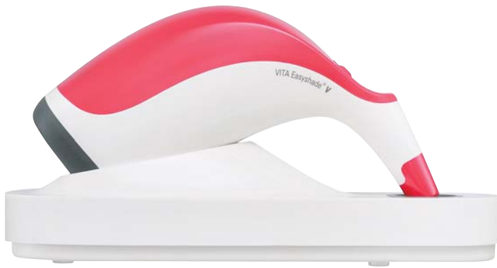
VITA Easyshade V im neuen Design.