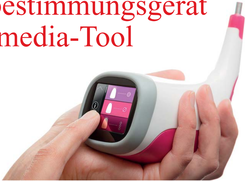
VITA Easyshade V: brillantes OLED-Farbtouchdisplay.

Die Basis für eine ästhetisch ansprechende – und damit den Patienten zufriedenstellende – Restauration ist eine optimale Farbanpassung der neuen Krone an die Nachbarzähne. Dank der digitalen Farbnahme stehen dem Zahnarzt heute effiziente Hilfsmittel für diesen Arbeitsschritt zur Verfügung, deren Potenzial weit über den klassischen visuellen Abgleich mit Farbskalen hinausgeht.