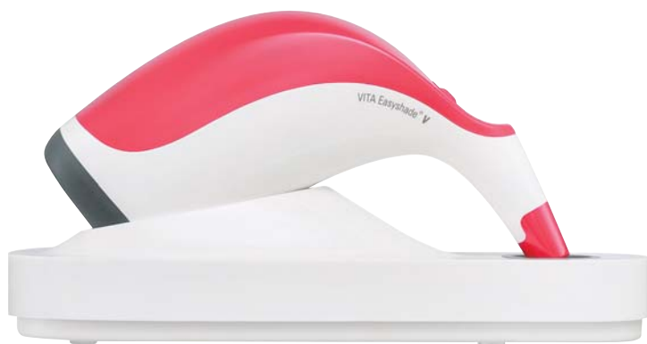
VITA Easyshade V im neuen Design.