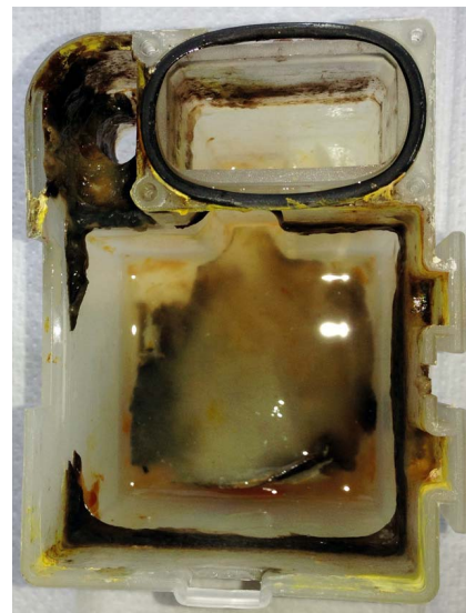
Biofilme in dentalen Behandlungseinheiten