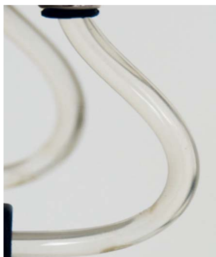
Mit SAFEWATER von BLUE SAFETY

Biozide sicher verwenden. Stets Produktinformationen und Kennzeichnung lesen.