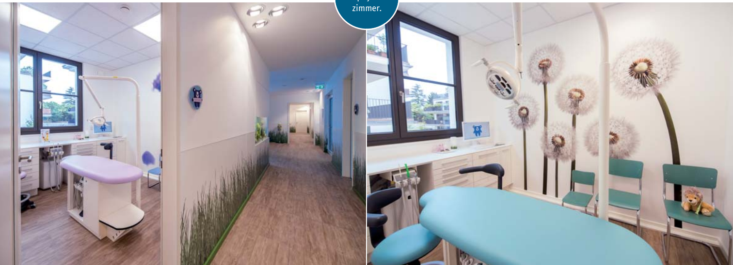
Blick ins Prophylaxezimmer.