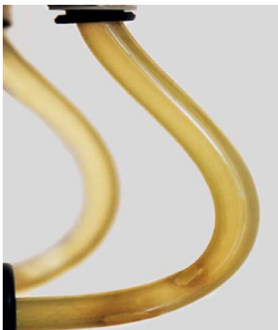
Wegen H 2 O 2 : Biofilmbildung

Video-Erfahrungsberichte auf www.bluesafety.com