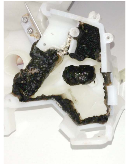
Biofilme in dentaler Behandlungseinheit und Trinkwasserinstallation