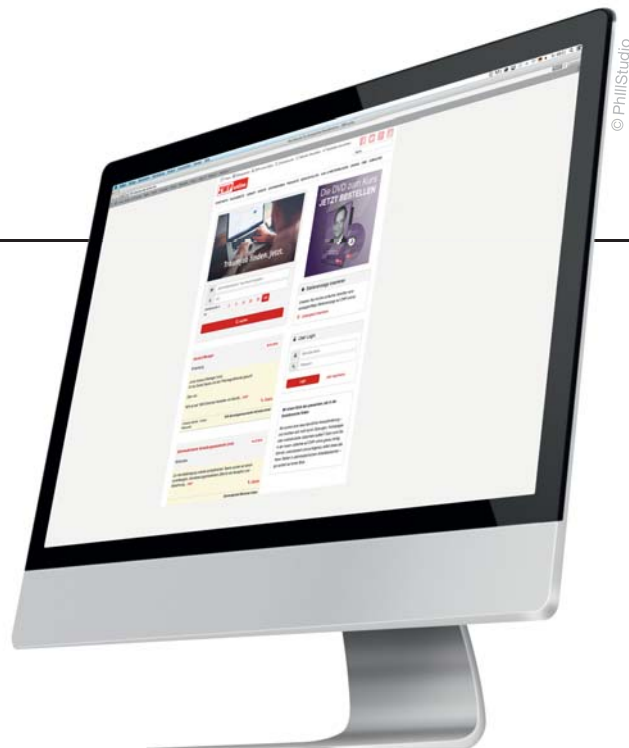
ZWP online Jobbörse