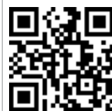
ZWP online Jobbörse