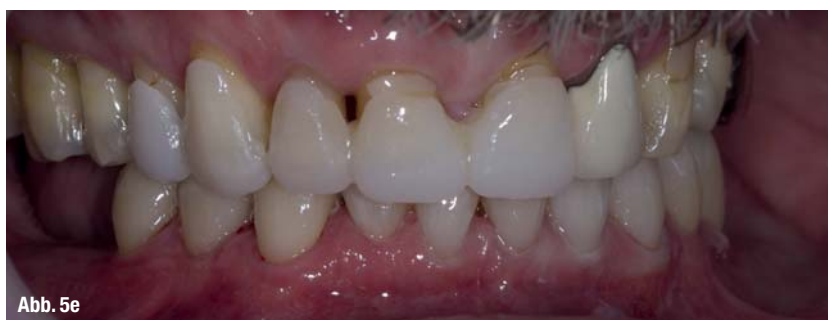
Abb. 5a–e _Vorher-Nachher-Bilder ohne und mit laborgefertigten Tabletops der Ober- und Unterkieferfront.

vollanatomisch gepresst, reduziert und mit e.max Ceram-Schichtkeramik fertiggestellt. Die Brücken wurden aus Zirkonoxidgerüst gefertigt und mit ZirPress-Keramik der Firma Ivoclar Vivadent überpresst. Nach Einprobe mit CHX-Gel erfolgte das Einsetzen adhäsiv und rein lichthärtend mit dem Syntac-System und Tetric EvoFlow der Farbe A1 (Firma Ivoclar Vivadent). Zur Sicherung des Behandlungsergebnisses bekam der Patient eine Aufbisschiene und wir nahmen ihn in das Recallprogramm unserer Praxis auf.