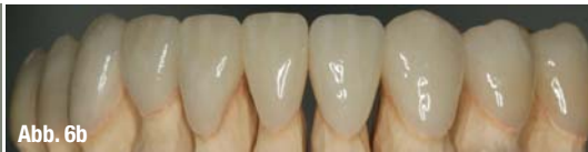
Abb. 6a-b_ Fertiggestellter Zahnersatz.