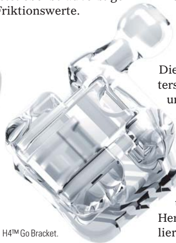
H4™ Go Bracket.

H4™ Go, das vollkommen transparente selbstligierende Bracket aus den USA, wird höchsten ästhetischen Ansprüchen gerecht. Hergestellt aus einem Hybridmaterial mit hohem Keramikfüllanteil, bietet es eine hohe Stabilität in Kombination mit problemlosem Bonding und Debonding. Der Schiebemechanismus ist aus anderen Systemen bekannt und bewährt. Das Material weist geringste Friktionswerte auf. Außerdem wurde das selbstligierende Keramikbracket ClearViz+™ SL in das Lieferprogramm aufgenommen. Die Rhodiumbeschichtete Klappe liegt mit einem Punktkontakt auf dem Bogen und bietet ebenso äußerst geringe Friktionswerte.