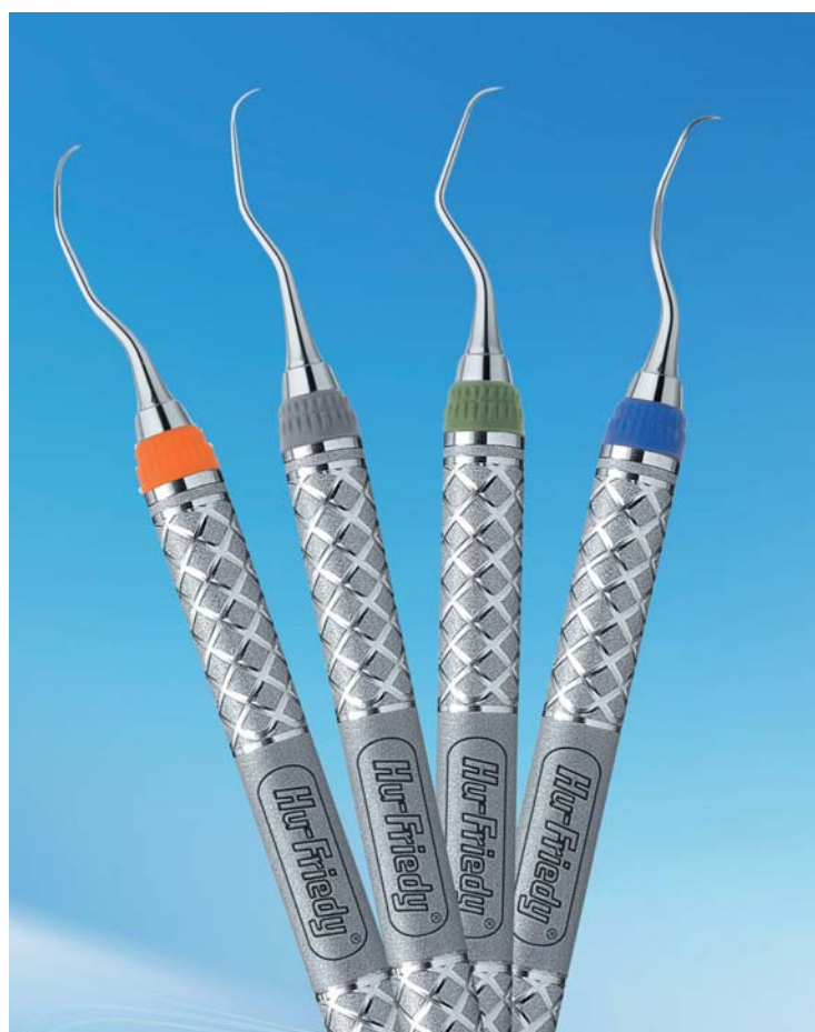
BioGent-Küretten von Hu-Friedy.

Hu-Friedy Mfg. Co., LLC. European Headquarters Astro Park Lyoner Str. 9 60528 Frankfurt am Main Tel.: 00800 48374339 (gratis) Fax: 00800 48374340 info@hufriedy.eu www.hu-friedy.eu