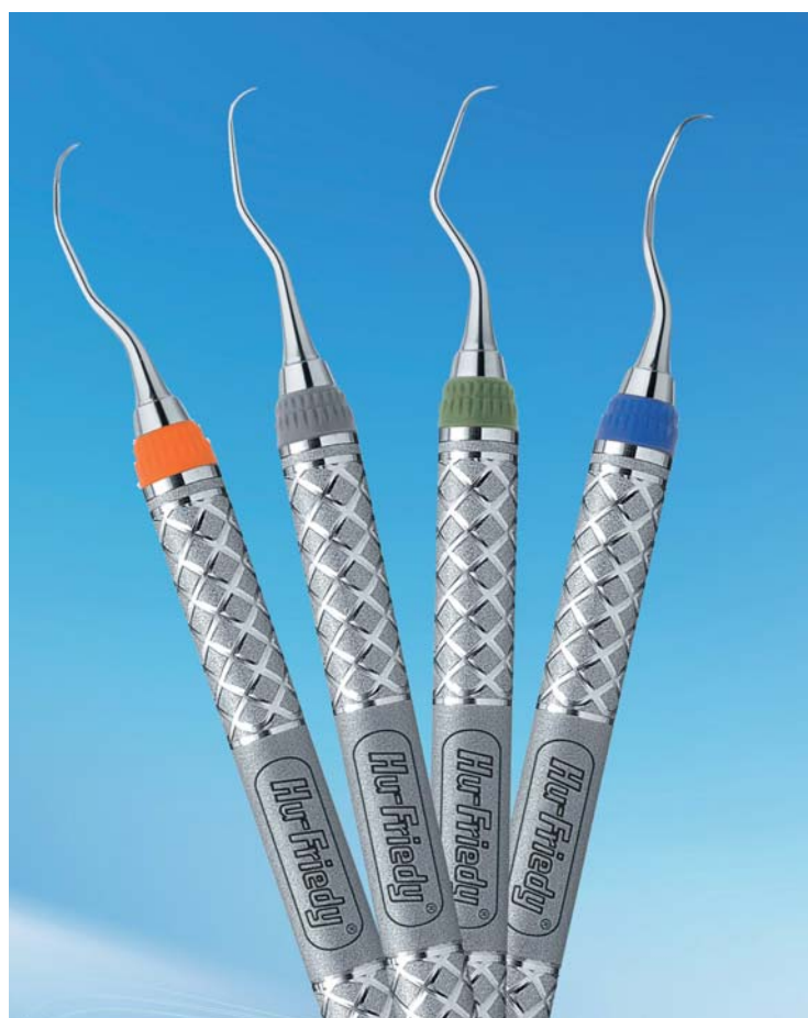
BioGent-Küretten von Hu-Friedy.