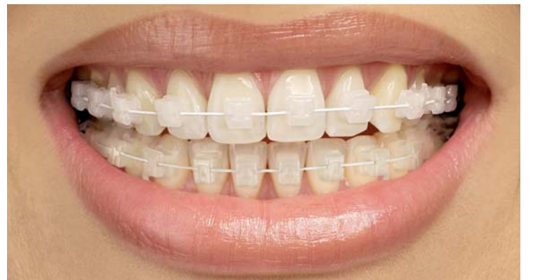
Ästhetik pur: Das vollästhetische Keramikbracket TruKlear® wurde um Brackets für den Unterkiefer ergänzt und ist jetzt von 5-5 OK/UK (3-5 mit Haken) erhältlich.

Noch in diesem Jahr lieferbar sein wird die dritte Generation des Keramikbrackets QuicKlear®. Das modifizierte, aktive SL-Bracket ist bis zu 0,4 mm flacher und weist eine rundere Form für einen noch besseren Tragekomfort auf. Die beliebten, von 5-5 im OK/UK (3-5 mit Haken) beziehbaren Brackets sind des Weiteren mit einem breiteren, rechteckigen Clip ausgestattet, dessen matte und weniger reflektierende Klammer eine optimale Rotations-, Angulations- und Torquekontrolle gewährt.