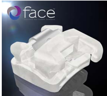
FACE Evolution steht als aktives selbstligierendes Bracketsystem oder optional als Hybridversion mit aktivem anterioren Segment und passiven Brackets auf Eckzähnen und Prämolaren zur Verfügung. Es wird mit den Brackets BioQuick® und QuicKlear® in den Slotgrößen .022" und .018" mit und ohne Haken angeboten.

Einer der bedeutendsten internationalen Termine des Fachbereichs Kieferorthopädie fand Mitte Juni im italienischen Venedig statt – der Jahreskongress der European Orthodontic Society (EOS). Rund 60 Dentalfirmen aus aller Welt präsentierten in der Stadt der Gondoliere jüngste Innovationen sowie bewährte Produkte. Unter ihnen selbstverständlich auch FORESTADENT, welches insbesondere bei den Brackets mit Neuheiten aufwartete. So stellte das Pforzheimer Unternehmen u. a. FACE Evolution vor, die weltweit erste und exklusiv bei FORESTADENT erhältliche Brackettechnologie der renommierten FACE-Gruppe. Gemäß deren Behandlungsphilosophie – näm-