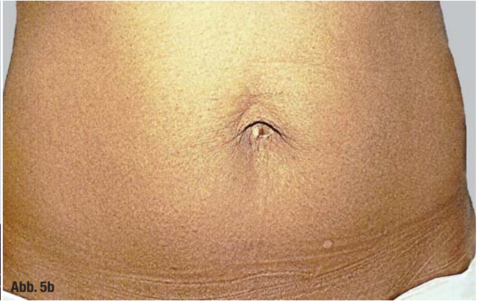
Abb. 5a und b: Hauterschlaffung am Bauch vor Beginn der Behandlung (a) und nach vier Sitzungen (b).

gerschaften und in Kombination mit Behandlungen des Fettgewebes und zur Behandlung der Oberarme nachgefragt. Bemerkenswert sind die Behandlungsergebnisse nach solariumgeschädigter Gesichts- und Halshaut mit Erschlaffung und Elastose oder bei extremer Lichtalterung der Haut. Auch hier zeigen sich meist bereits nach der ersten von vier bis sechs Behandlungen beeindruckende Soforteffekte. Neben der Faltenbehandlung lässt sich in der Regel ein guter Lifting-Effekt an Hals, unterem Gesicht und Mittelgesicht erzielen. Durch erfahrene Behandler kann auch der Übergang Mittelgesicht/Arcus marginalis im Sinne einer deutlichen Verbesserung der „Tränensäcke“ und/oder Festoons effektiv behandelt werden. Gerade die Behandlung dieser Region erfordert aber sehr gut geschultes Fachpersonal.