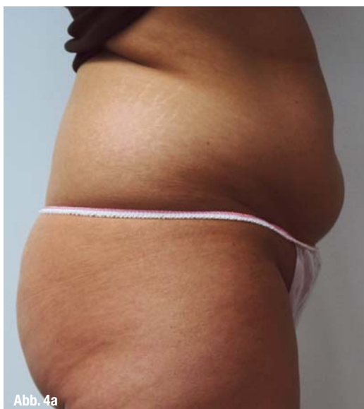
Abb. 4a und b: Reduzierung hartnäckiger Fettdepots an Hüfte und Abdomen.

Die Anwendung zur Hautstraffung ist sehr vielfältig und wird am häufigsten für das Gesicht, den Hals, für den Bauch insbesondere nach Schwan-