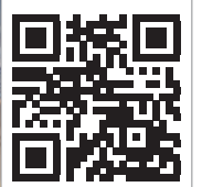
Abb. 5: Das DENTSPY Implants Magazin Deutschland/Schweiz ist pünktlich zum Kongress mit neuer Website www.dentsplyimplants-magazin.de erschienen. – Abb. 6: DENTSPY Implants präsentierte auf dem DIKON Kongress das innovative Waschtray für Reinigung und Sterilisation.

DENTSPY Implants [Infos zum Unternehmen]