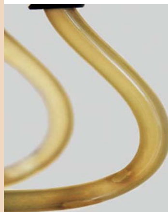
Wegen H 2 O 2 : Biofilmbildung

Klingt stichhaltig? Ist es auch. Und Sie können das auch.