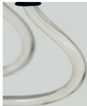
Mit SAFEWATER von BLUE SAFETY

Informieren und absichern. Jetzt. Kostenfreie Hygieneberatung unter 0800 25 83 72 33 Erfahrungsberichte auf www.safewater.video