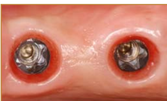
Konische Innensechskantverbindung mit einer basalen parallelwandigen Torxverbindung