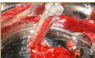
Mehrfachbohrer mit Sammelkammer für autologes Knochenmaterial