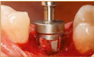
Tiefen- / Anschlagstop