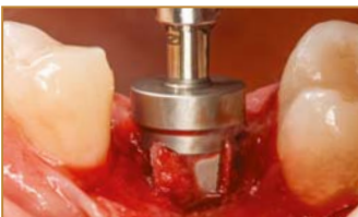
Tiefen- / Anschlagstop