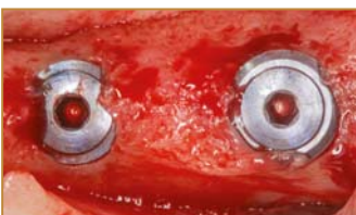
Innenliegende Deckschraube und Knochenüberlagerung an der Implantatschulter bei Freilegung