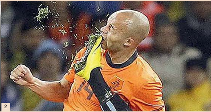
Abb. 1: OPG eines 20-jährigen afrikanischen Profifussballers. – Abb. 2: Zahnunfälle auch im Fussball – Abb. 3: Dentosafe Zahnrettungsbox. (links unten) – Abb. 4: Leukoplakische Veränderung nach Snuskonsum. – Abb. 5: Marathonläufer.

Und nicht selten ist auch der Zeitpunkt sehr ungünstig. Verschiedene Berichte und Beispiele aus der Vergangenheit haben gezeigt, dass Spitzenathleten manchmal kurz vor einem Wettkampf eine solche Problematik entwickelten und deswegen nicht oder nur stark geschwächt teilnehmen konnten. Umso ärgerlicher ist es, wenn am Tag X oder am Ende der Wettkampfsaison nur wenig für den Spitzenplatz gefehlt hat und man sich eingestehen muss, dass es ein vermeidbares Problem gewesen wäre.