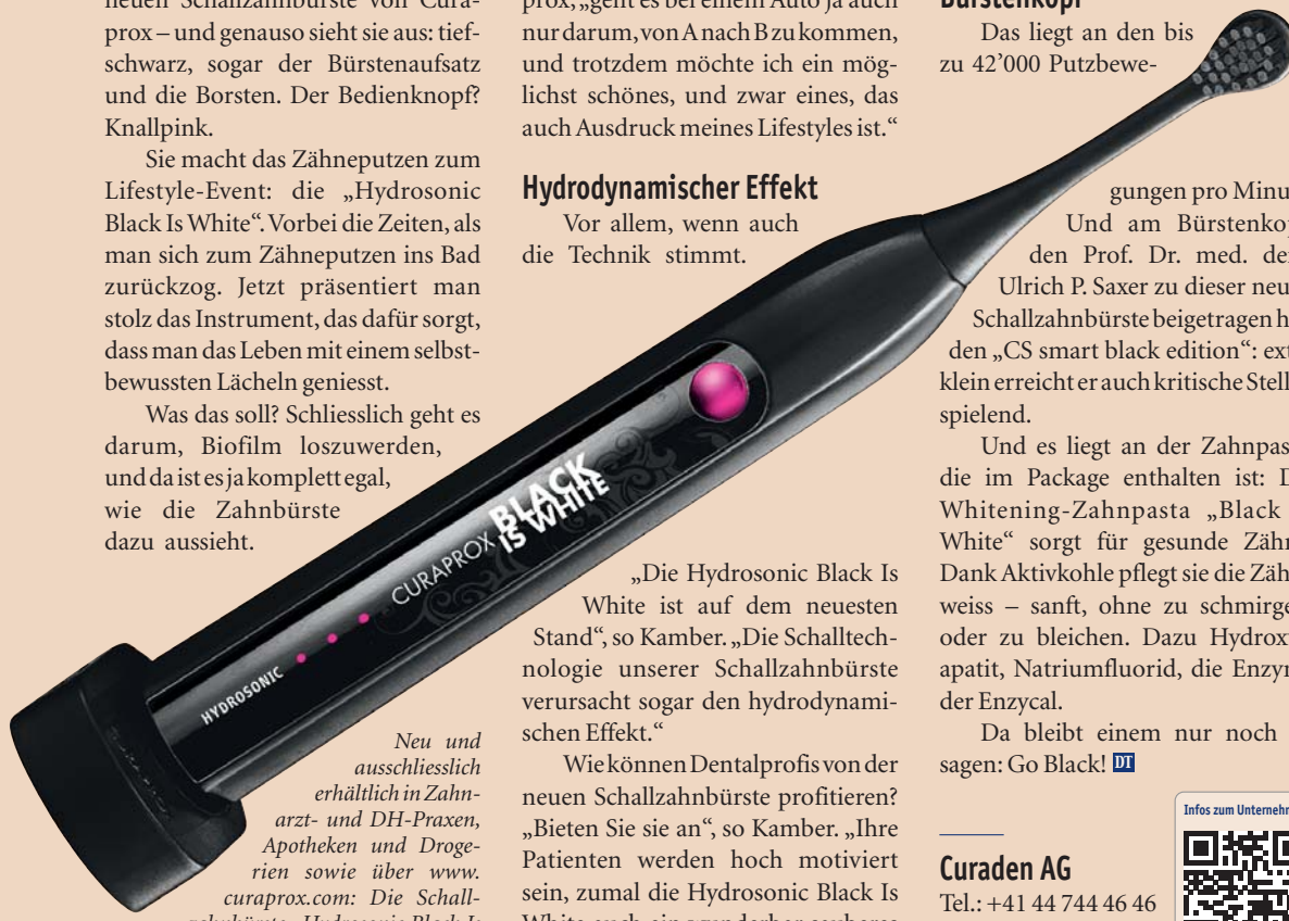
Neu und ausschliesslich erhältlich in Zahnarzt- und DH-Praxen, Apotheken und Drogerien sowie über www.curaprox.com : Die Schallzahnbürste „Hydrosonic Black Is White“ von Curaprox.