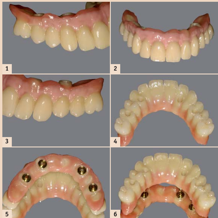
Abb. 1–6 zeigen die Patientenarbeit des Monats September 2015 unter Verwendung von goldeloxierten Generikaprodukten, welche durch ihren warmen Farbton im sichtbaren Bereich einen ästhetischen Vorteil bieten. Der Spezialschraubendreher mit speziell gehärtetem Rundkopf und das einzigartige Abutmentdesgin (Generikaprodukt) erlauben abgewinkelte Verschraubungen bis zu einer Neigung von 30 Grad.

tionskosten zu senken, ohne dass die Kunden unverantwortliche Qualitätseinbußen oder eine Beeinträchtigung des ästhetischen Erscheinungsbildes in Kauf nehmen müssen. Die gute Botschaft: Wir machen es möglich, es gibt einen Weg. Wir setzen den Fokus auf fundierte und durchdachte