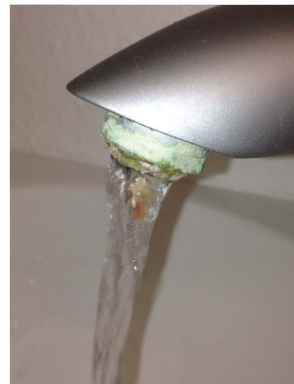
Biofilme in dentaler Behandlungseinheit und Trinkwasserinstallation