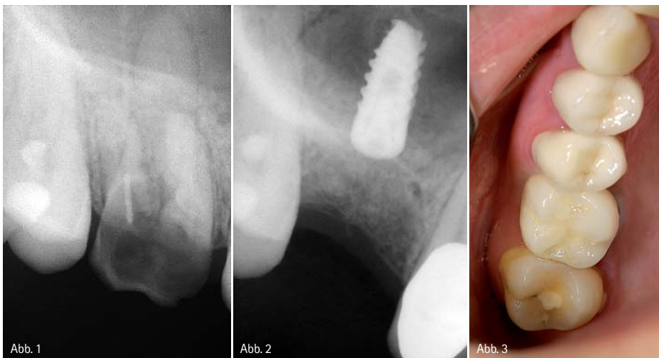
Abb. 1: Das Röntgenbild zeigt ein Infiltrat, ausgehend von 16. – Abb. 2: Inserierung eines Implantats (4,2 x 10 MIS Seven), palatinal. – Abb. 3: Prothetische Versorgung mit einer Einzelkrone.

Die implantologische Versorgung des posterioren Oberkiefers ist nach wie vor eine Herausforderung, da der vorhandene Knochen in Quantität und Qualität limitiert sein kann und häufig ist. Doch genau in dieser Region ist eine Lastaufnahme von 50–400 N oder auch mehr zu erwarten. Nachfolgend wird ein Fall beschrieben, der für den Autor dieses Beitrages eine Bestätigung ist, mit dem Wissen um anatomische Ressourcen den Aufwand zu limitieren.