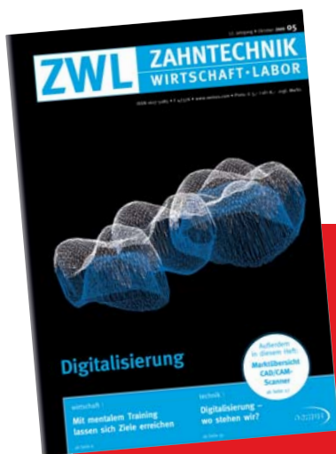
Quelle Titelbild: Bildsequenzen von intraoral aufgenommenen Quadranten-Scans werden zu virtuellen Modellen mit Gegenbeziehung geformt (Fa. AG Keramik).

Diese Ausgabe auch als E-Paper auf : www.zwp-online.info/publikationen