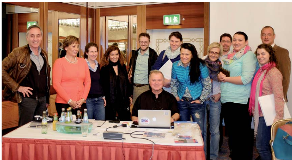
Der Referent im Kreise der Seminarteilnehmer.

Am Ende des Tages verglich Dr. Seeholzer sein Seminar mit Kuchenbacken: Er habe in den vergangenen Stunden seinen Zuhörern einzelne Zutaten mitgegeben. Nun würden diese Zutaten im Unterbewusstsein arbeiten und sich entwickeln – dann könnten die Teilnehmer daraus das große Ganze „backen“. Entscheidend dabei sei es, ein klares Ziel zu definieren und dieses beharrlich zu verfolgen: „Anfangs ist es zwar schwierig und es benötigt viel Anlauf, um die Steine zu überwinden, die Ihnen im Weg liegen – aber es lohnt sich!“