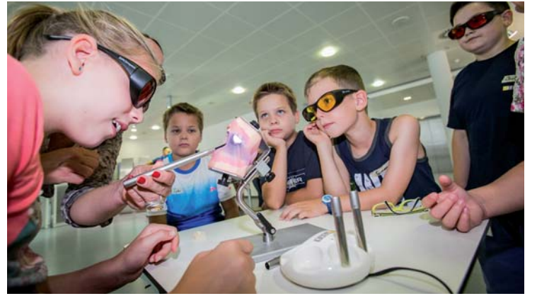
Einblicke in den Beruf des Zahnarztes: Mit dem SIROInspect gingen die Mitarbeiterkinder auf Kariessuche.

Das abwechslungsreiche Programm hat den Sirona-Nachwuchs sowie die Eltern überzeugt: „Die Ferienbetreuung ist wirklich gelungen! Die Kinder erleben spannende Dinge und sind bei Sirona gut aufgehoben.