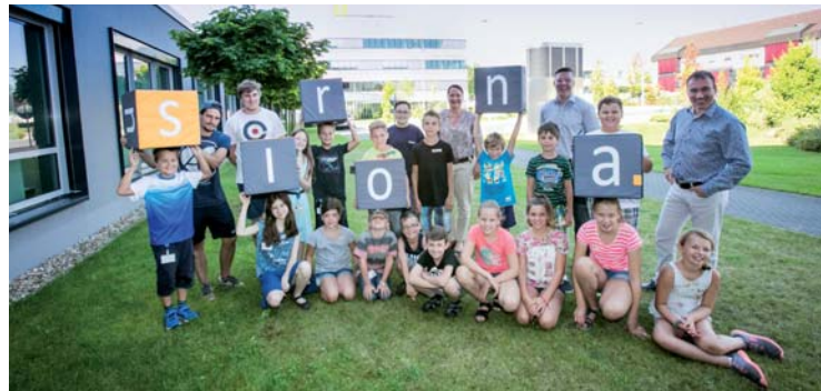
Spiel und Spaß standen bei den Sirona-Ferienspielen auf der Tagesordnung: Es wartete ein abwechslungsreiches Programm auf die 18 Jungen und Mädchen.