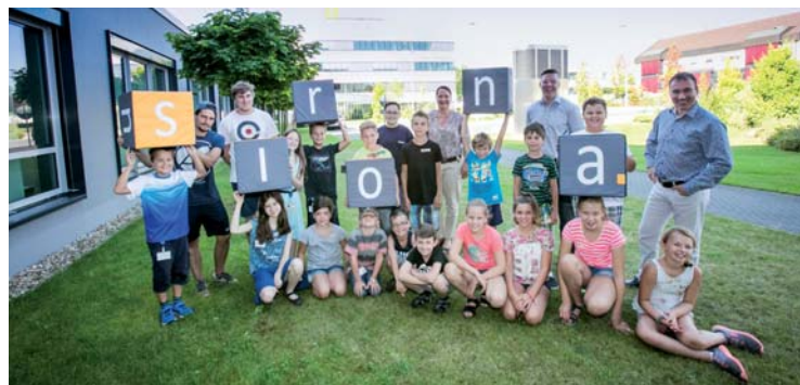
Spiel und Spaß standen bei den Sirona-Ferienspielen auf der Tagesordnung: Es wartete ein abwechslungsreiches Programm auf die 18 Jungen und Mädchen.