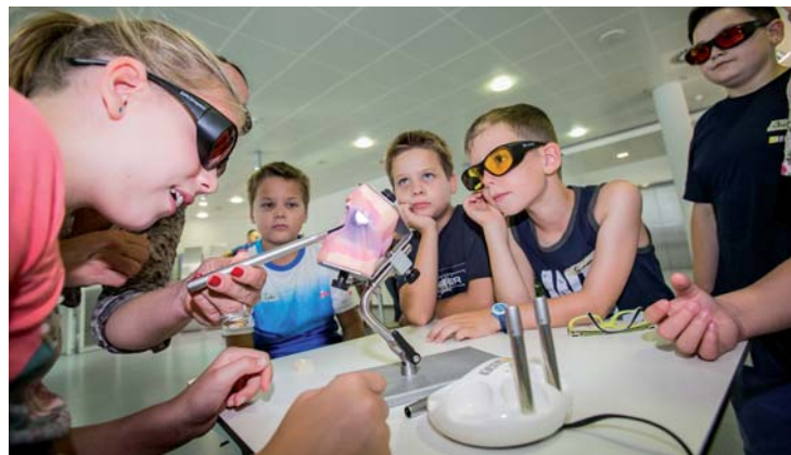
Einblicke in den Beruf des Zahnarztes: Mit dem SIROInspect gingen die Mitarbeiterkinder auf Kariessuche.

Das abwechslungsreiche Programm hat den Sirona-Nachwuchs sowie die Eltern überzeugt: „Die Ferienbetreuung ist wirklich gelungen! Die Kinder erleben spannende Dinge und sind bei Sirona gut aufgehoben.