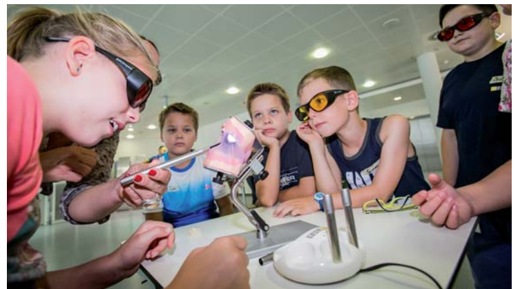
Einblicke in den Beruf des Zahnarztes: Mit dem SIROInspect gingen die Mitarbeiterkinder auf Kariessuche.

Das abwechslungsreiche Programm hat den Sirona-Nachwuchs sowie die Eltern überzeugt: „Die Ferienbetreuung ist wirklich gelungen! Die Kinder erleben spannende Dinge und sind bei Sirona gut aufgehoben.