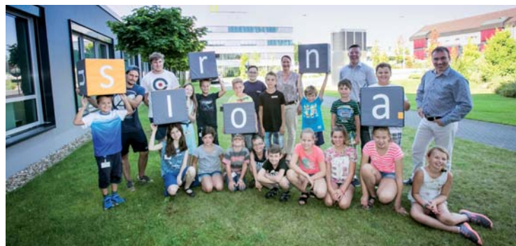
Spiel und Spaß standen bei den Sirona-Ferienspielen auf der Tagesordnung: Es wartete ein abwechslungsreiches Programm auf die 18 Jungen und Mädchen.