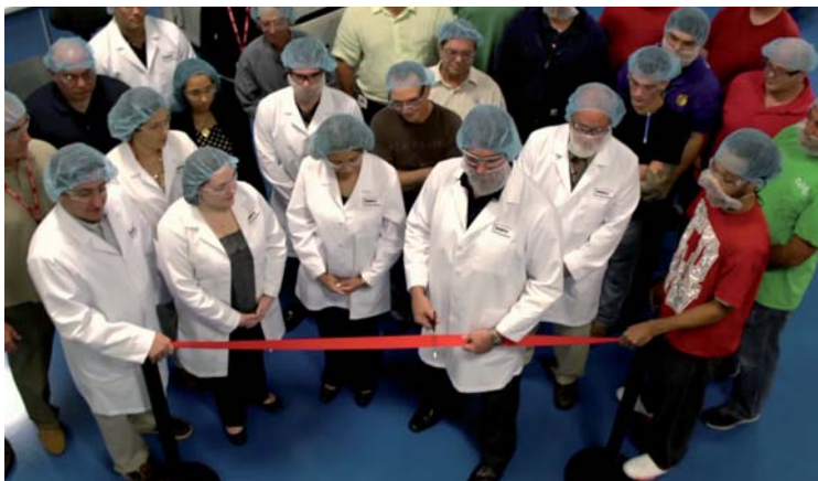
Feierliche Einweihung der neuen DENTSPLY GAC Fertigungsanlage in Florida.

KFO-Komplettanbieter eröffnet hochmoderne Produktion in Florida.