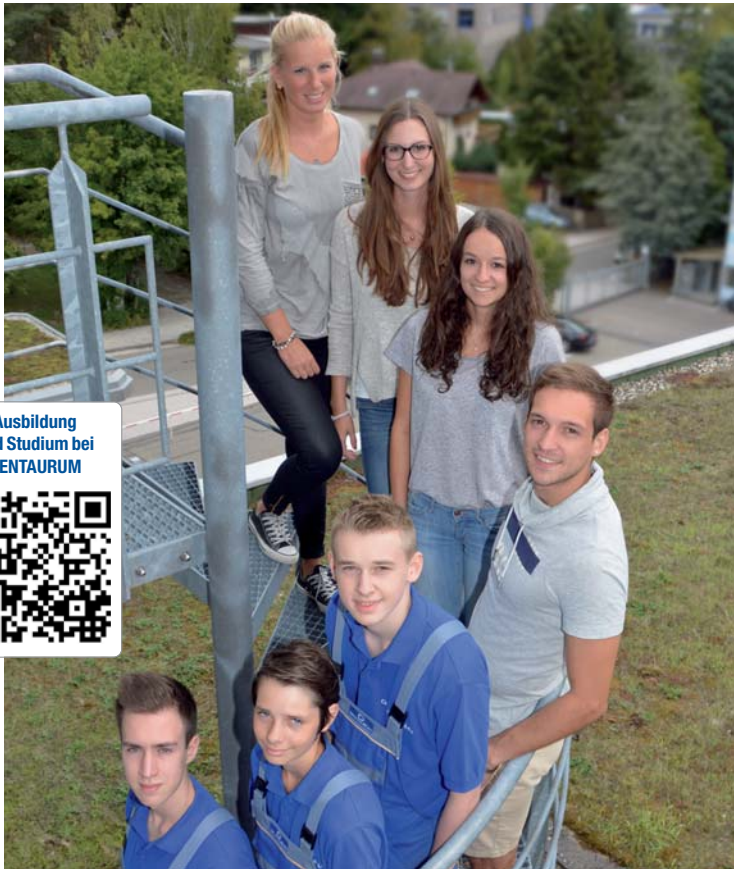
Hochmotiviert haben die sieben jungen Leute ihre Ausbildung bei Dentaorium begonnen.

Nachwuchs begann Ausbildung im September.