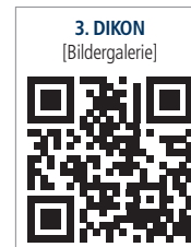
3. DIKON [Bildergalerie]

Am 18. und 19. September 2015 fand in Berlin der 3. DENTSPLY Implants Kongress (DIKON) statt. Unter dem Motto „Richtig entscheiden – Patienten begeistern“ bot die zweitägige Veranstaltung einen spannenden wissenschaftlichen Diskurs und praxisorientierte Workshops.