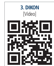
3. DIKON [Video]