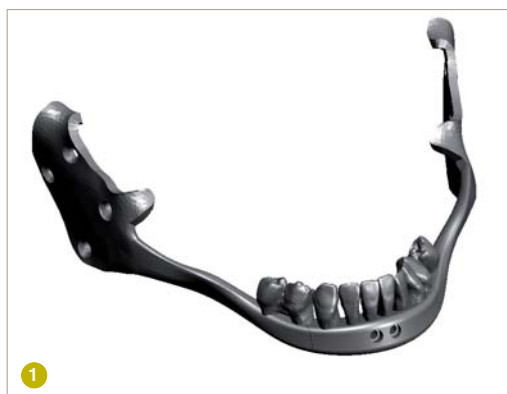
Abb. 1: Einzigartiges Implantat zur Rekonstruktion des nahezu vollständig fehlenden Unterkiefers.