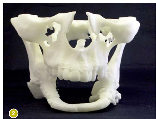
Abb. 2: Nachbildung des Patientenskeletts; der fehlende Unterkiefer wurde durch ein Fibulatransplantat ersetzt.