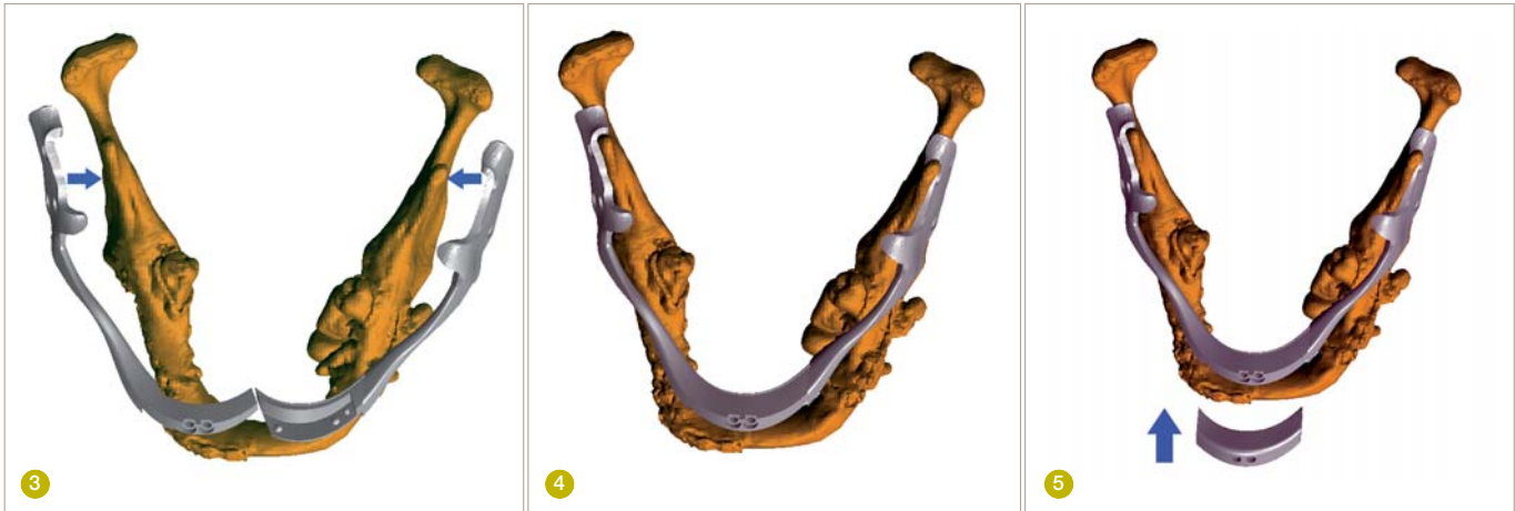
Abb. 3: Linkes und rechtes Implantatsegment wurden jeweils so entworfen, dass sie über die entsprechenden Unterkieferäste gelegt und daran befestigt werden können.