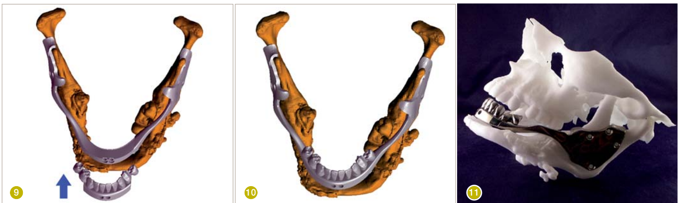
Abb. 9: Einführen des prothetischen Mittelstücks mit der daran befestigten Zahnprothese. Abb. 10: Anbringen und Befestigen des prothetischen Mittelstücks. Abb. 11: Die finale Prothese am Patientenmodell.

Ebenso zu erwähnen ist das besondere Design der Seitenbügel der beiden größeren, seitlichen Implan-