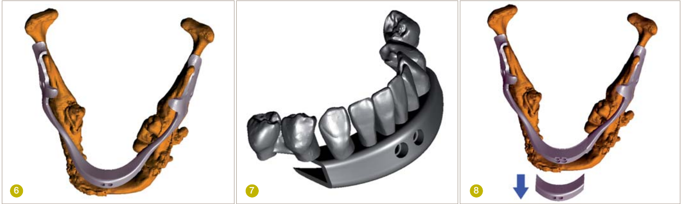
Abb. 6: Das Mittelstück soll sicherstellen, dass die zwei Seitensegmente nicht verrücken. Abb. 7: Das prothetische, permanente Mittelstück. Abb. 8: Nach dem Heilungsprozess wird das chirurgische Mittelstück entfernt und dafür die prothetischen Komponenten eingesetzt.