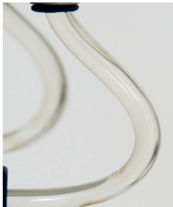
Mit SAFEWATER von BLUE SAFETY

Tausende Behandlungseinheiten erfolgreich dauerhaft saniert