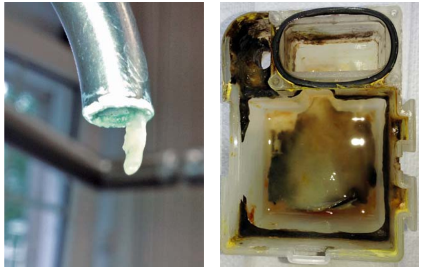
Biofilme in dentaler Behandlungseinheit und Trinkwasserinstallation

In diesem Fall beträgt die Kostenersparnis durch SAFEWATER 4.900 €. Jährlich.