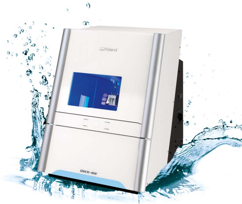
Die neue DWX-4W Nassschleifeinheit