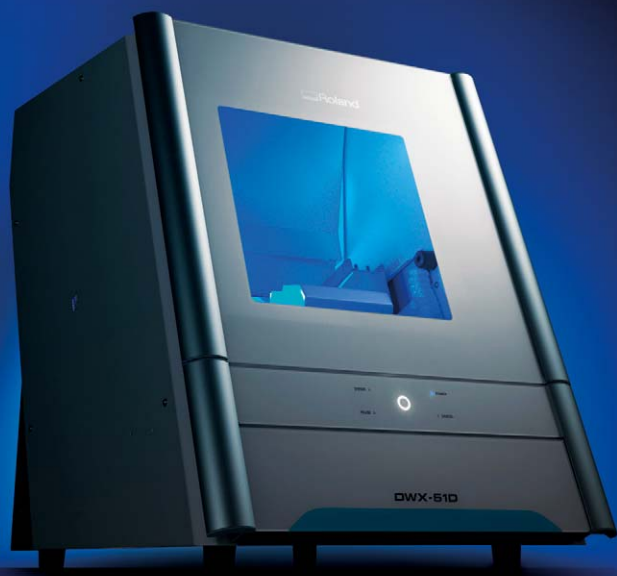
Die neue DWX-51D Dental-Fräseinheit