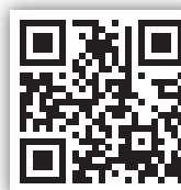
Ivoclar Vivadent Infos zum Unternehmen