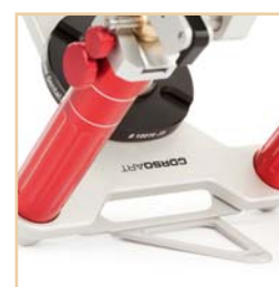
Abnehmbare Kippstütze 45°