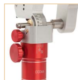
Bennett- & Kondylenverstellung

Artex® und Splitex® sind eingetragene Marken der AmannGirrbach GmbH, 75177 Pforzheim, DE - Adesso Split® ist eine eingetragene Marke von K. Baumann, 75210 Kelttern, DE - SAM® ist eine eingetragene Marke der SAM Präzisionstechnik GmbH, 82131 Gauting, DE - CORSOART® ist eine eingetragene Marke von C. Althaus, 31515 Wunstorf, DE