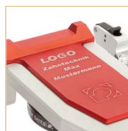
Individuelle Personalisierung des Artikulators durch Laserverfahren