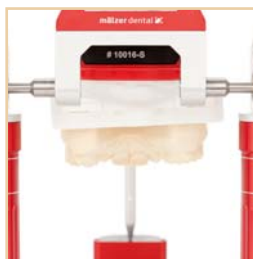
Großes Sichtfeld im dorsalen Bereich