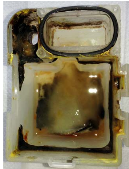
Biofilme in dentalen Behandlungseinheiten