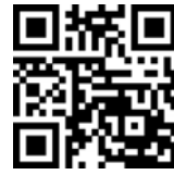
Infos zum Autor

Das gleiche gilt für die manuelle Strukturanalyse als weiterführende Zusatzuntersuchung (CMDmanu) sowie die Erfassung der Schmerzentwicklung und deren Ort über Zeit (CMDpain). Um eine Übersicht über die verschiedenen, zu verschiedenen Zeiten erhobenen Einzelbefunde auf einen Blick grafisch zu ermöglichen, werden diese in CMDfact 4 fortan in einer übersichtlichen Timeline integriert (Abb. 8).