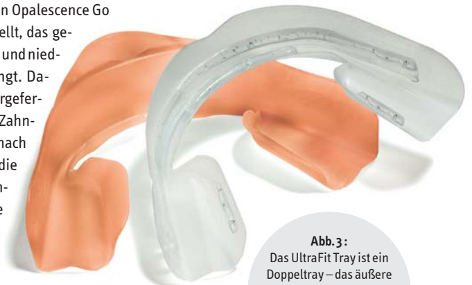
Abb. 3: Das UltraFit Tray ist ein Doppeltray – das äußere Tray hilft beim Einsetzen, das innere Tray verbleibt auf der Zahnreihe und formt sich optimal an.

Vorgefertigte Zahnaufhellungsschienen als Prophylaxe-Plus – ein ideales Tool für erfolgreiches Praxismarketing und ein Alleinstellungsmerkmal, das Sie garantiert gegenüber vielen Praxen haben werden. ◀