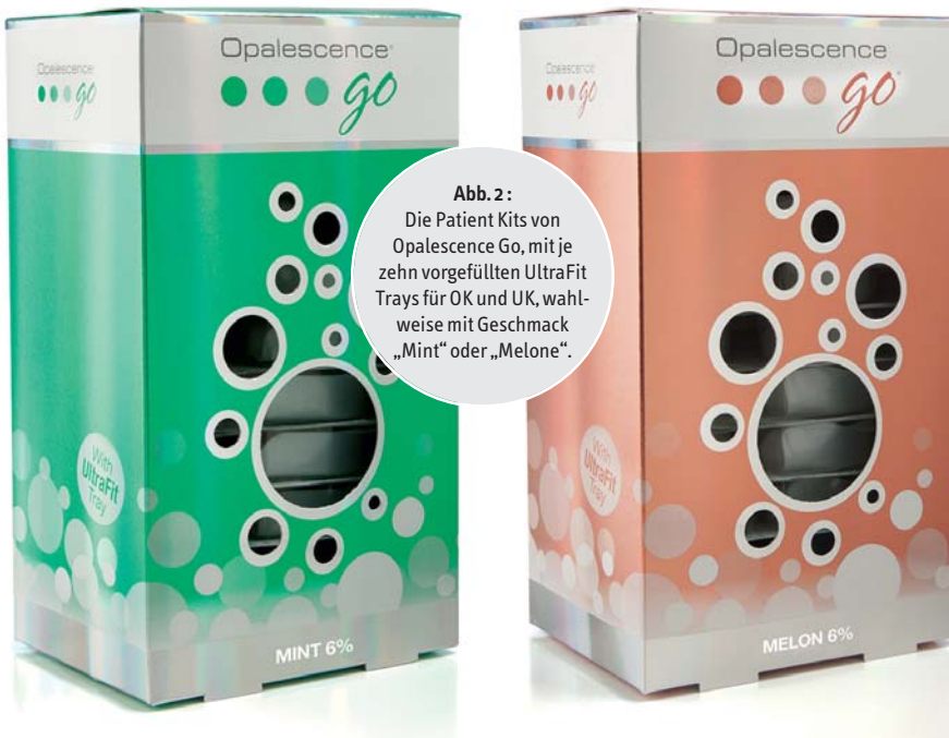
Abb. 2: Die Patient Kits von Opalescence Go, mit je zehn vorgefüllten UltraFit Trays für OK und UK, wahlweise mit Geschmack „Mint“ oder „Melone“.

hygienikerin ohnehin meist dem Patienten einen Spiegel in die Hand: So kann er sich an den sauberen und gepflegten Zähnen, von denen alle äußeren Flecken und Beläge entfernt wurden, erfreuen. Oft lächelt der Patient zufrieden – mancher aber hätte sich sein Gebiss noch etwas schöner und strahlender gewünscht. Ein Leichtes wäre es an dieser Stelle folglich, den Patienten auf die Zufriedenheit mit seiner Zahnfarbe anzusprechen und ggf. eine Bleachingbehandlung anzubieten. Dies erfordert jedoch etwas Mut, Kommunikationsfreude und Talent im Bereich Gesprächsführung, zumal es sich bei PZR-Behandlungen meist um delegierte Prozesse handelt und die Helferin folglich das „Verkaufsgespräch“ führen müsste.