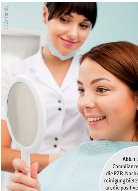
Abb. 1: Großer Compliance erfreut sich die PZR. Nach erfolgter Zahnreinigung bietet es sich deshalb an, die positive Stimmung aufzugreifen und über die Möglichkeit einer Zahnaufhellung zu informieren.

Geht es um die Generierung von Privat- und Zuzahlerleistungen, gibt es kein Erfolgsrezept, was sich auf jede Praxis anwenden lässt. Zu verschieden sind die Praxisausrichtungen samt den Zielgruppen, zu unterschiedlich die lokale Situation und zu differenziert das Engagement des Praxisteams in diesem Segment. Zudem wird oftmals vermutet, dass der Patient nicht an zusätzlichen Leistungen interessiert sei, und die Angst überwiegt, während des Gesprächs beim „Verkauf“ erkannt zu werden und den Patienten schlimmstenfalls zu verlieren. Dabei geht