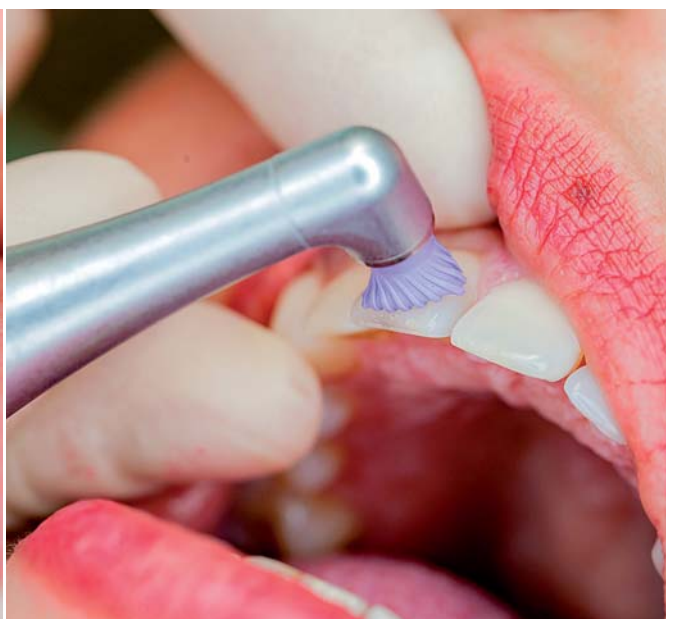
Abb. 5: Dank des kleinen Winkelstückkopfes hat man immer alles im Blick – auch Behandlungsfelder im distalen Bereich. – Abb. 6: W&H bietet mit seinen Proxeo Hand- und Winkelstücken und dem Einwegsystem der bekannten Marktgröße Young Dental ein vielfältiges Portfolio zur professionellen Prophylaxebehandlung.