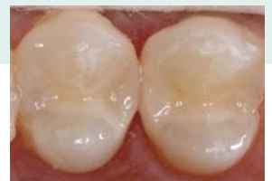
Finale Restauration mit EQUIA Forte

GC Germany GmbH Seifgrundstrasse 2 61348 Bad Homburg Tel. +49.61.72.99.59.60 Fax. +49.61.72.99.59.66.6 info@gcgermany.de http://www.gcgermany.de