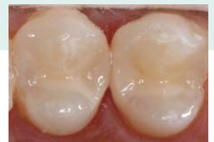
Finale Restauration mit EQUIA Forte

GC Germany GmbH Seifgrundstrasse 2 61348 Bad Homburg Tel. +49.61.72.99.59.60 Fax. +49.61.72.99.59.66.6 info@gcgermany.de http://www.gcgermany.de