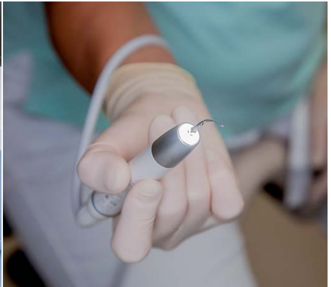
Abb. 3: Tigon+ sorgt für entspanntes Scaling. Verschiedene Leistungsmodi ermöglichen ein substanzschonendes Vorgehen. – Abb. 4: Der 5-fach-LED-Ring sorgt für eine optimale Ausleuchtung und Kontrastsehen wie bei Tageslicht.

Instrumenten bzw. Scalerspitzen sie greifen muss. Sie erklärt Theresa die einzelnen Schritte und beantwortet Fragen, bevor sie mit der PZR beginnt.