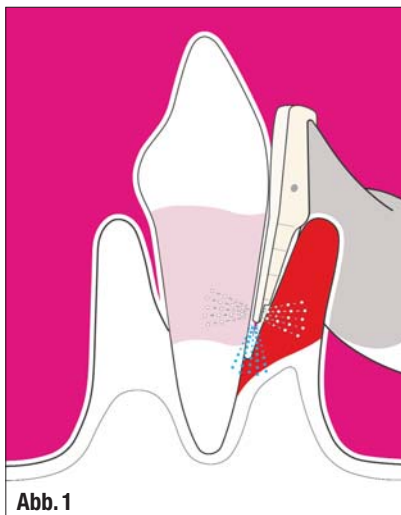
▲ Abb. 1: Funktionsweise Air-Flow Perio-Düse (EMS).

■ Seit mehr als 25 Jahren zählt der routinemäßige Einsatz von Pulverstrahlgeräten zur Reinigung und Politur von Zahnoberflächen in der prophylaktischen Zahnheilkunde zum Behandlungsstandard. Die enormen Fortschritte bei der Entwicklung innovativer Pulver und neuer Applikationsmöglichkeiten für Luft-Pulver-